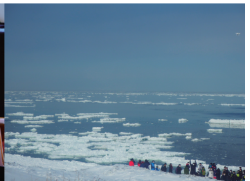
オホーツク海と流水