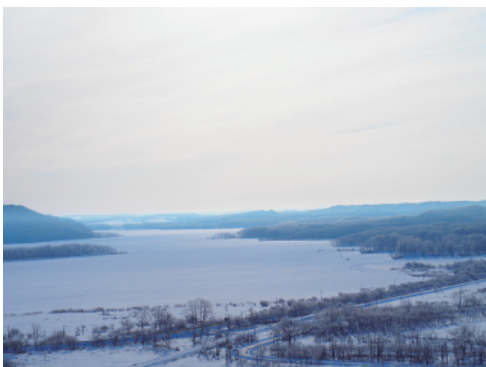
釧路湿原の展望台から塘路湖を臨む

限界集落にある小さなゲストハウスに泊まる。宿泊客は自分一人だけだった。関西から入植してきた若い夫婦の話聞き、じゃがいもの団子鍋をつついた。