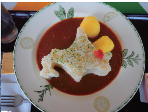
福神漬けの場所が小清水町