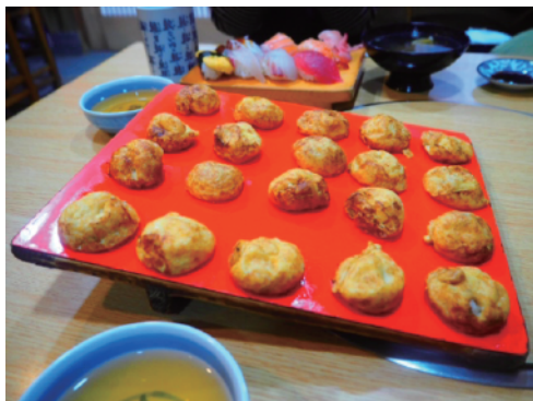
明石焼きは大きなお皿に乗ってきた

翌朝、「りんくうタウン」のアウトレットで名産の「泉州タオル」をお土産に購入。関西国際空港12:25発のピーチ航空で新潟へ戻った。ちなみに、こちらの運賃は諸経費込で4,550円。今や東京へ行くよりも、お得に関西に行くことができる。