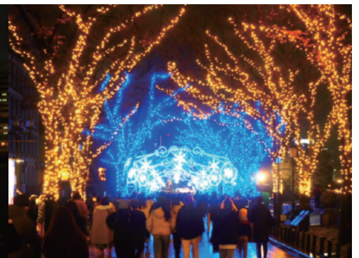
中之島のイルミネーション