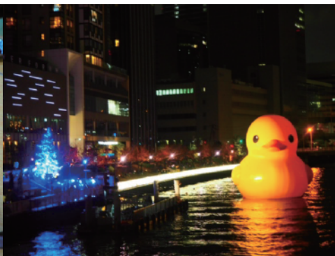
巨大アヒルは迫力満点