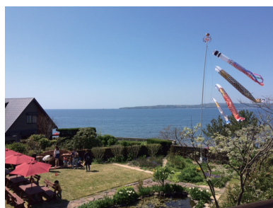
(写真左) ドンデン山 登山道 (右) 「しまふうみ」より 真野湾を望む